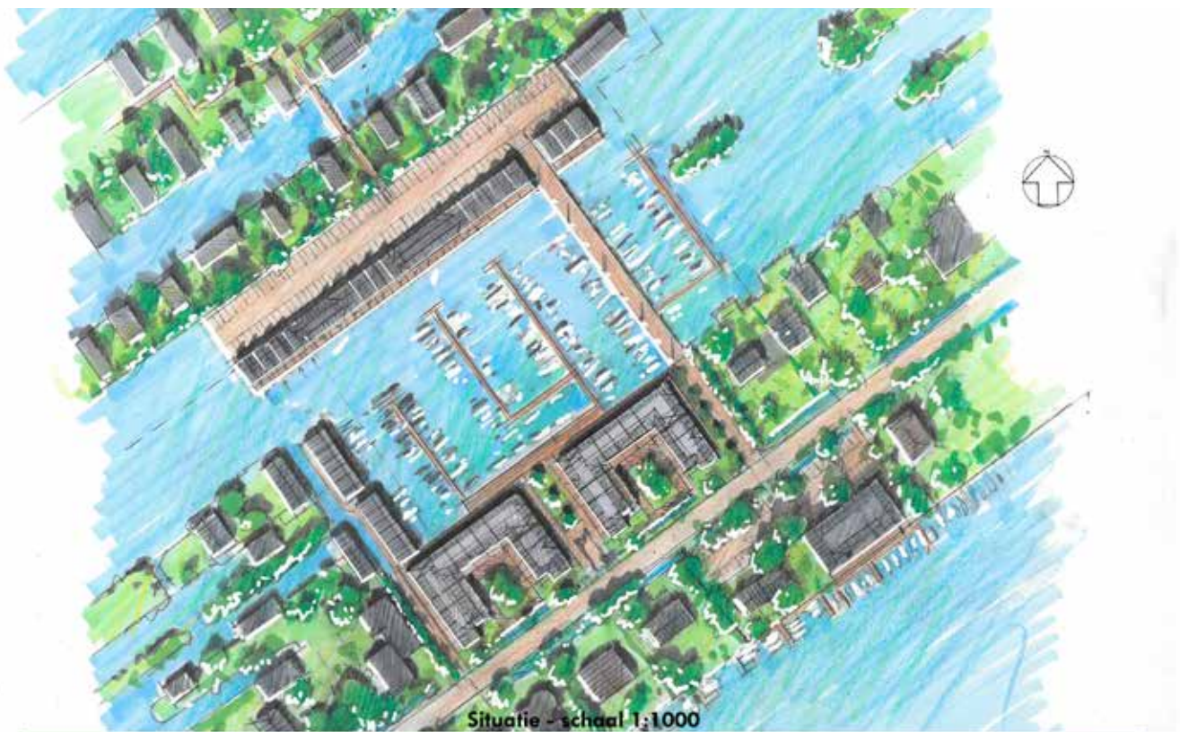
Situatie - schaal 1:1000

meter naar voren worden geplaatst. Uiteraard in goed overleg met de boothuseigenaren, het Arkenpark en andere belanghebbenden, zoals Waternet. Deze oplossing is bedacht om het parkeren voor het Arkenpark en de boothuizen dichterbij te realiseren. Gecombineerd met een ondergrondse parkeergarage voorkomt dat parkeeroverlast aan de Baambrugse Zuwe. Om de parkeerplaats achter de boothuizen toegankelijk te maken, is een smalle toegangsweg over het water nodig. Dit wordt geen kolossale weg, maar juist een elegante, mooi vormgegeven eenrichtingsweg. Boven op de boothuizen zijn in deze schets appartementen getekend om het aanzicht van de boothuizen te verbeteren. De boothuizen worden in die situatie mooi geïntegreerd in het geheel. Hiervoor geldt hetzelfde: uiteraard alleen in goed overleg met de boothuseigenaren.